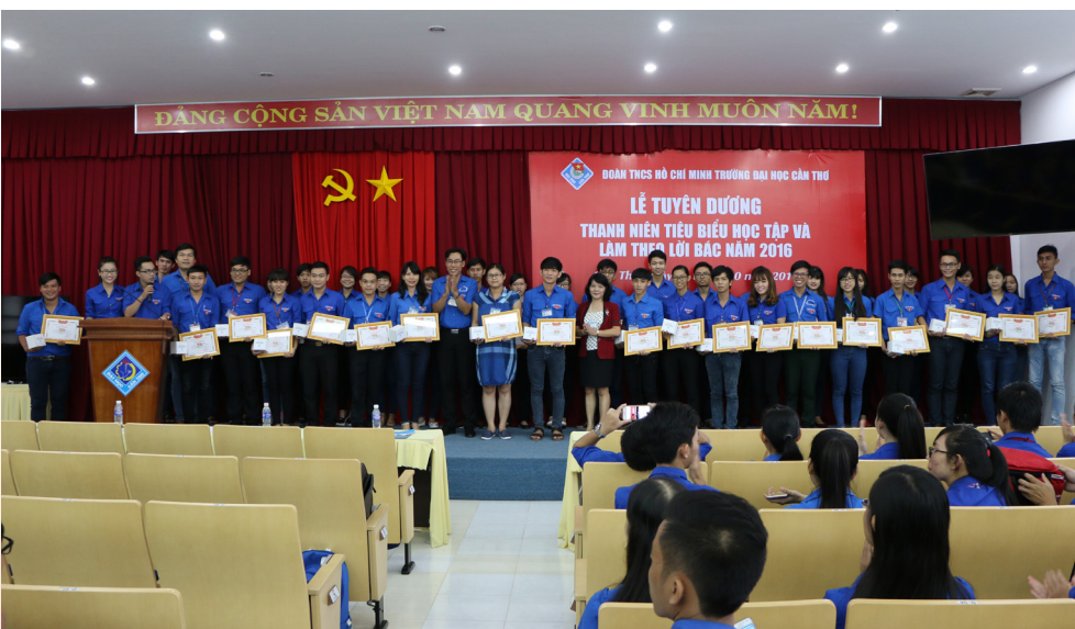
Trao Giấy khen và quà tặng cho các cá nhân tiêu biểu trong học tập và làm theo lời Bác.

Chi đoàn được xếp loại vững mạnh năm học 2015-2016; tích cực trong việc thực hiện cuộc vận động “Học tập và làm theo tư tưởng, đạo đức và phong cách Hồ Chí Minh” bằng những việc làm thiết thực, cụ thể.