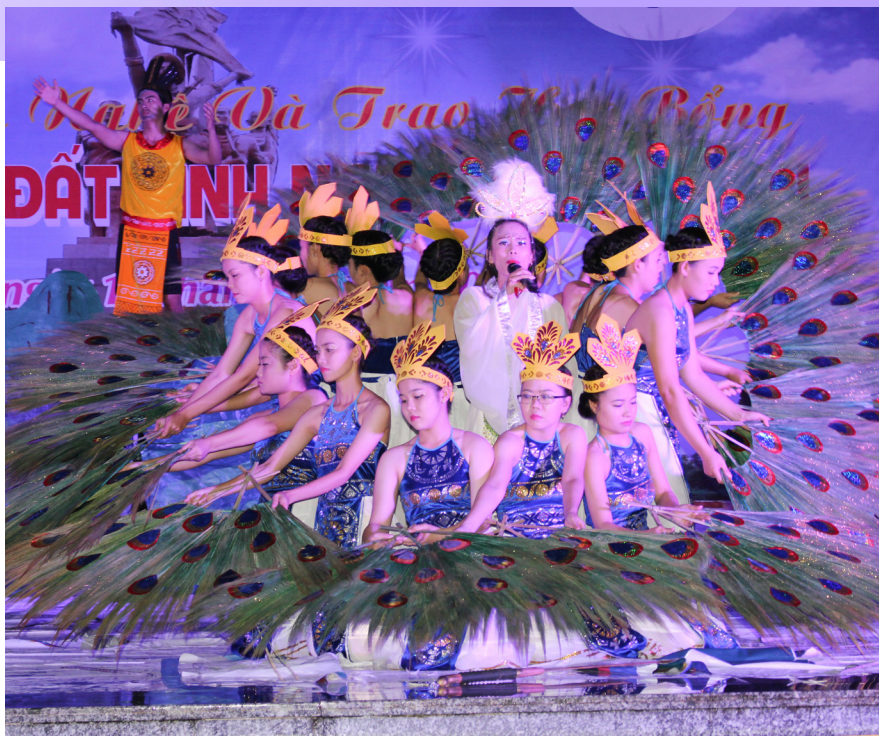
Nhạc kịch Trọng Thủy- Mị Châu, tiết mục dự thi của chi hội sinh viên Càng Long và Duyên Hải.

Bằng cả trái tim và lòng nhiệt huyết của tuổi trẻ, các bạn sinh viên đã cháy hết mình trên sân khấu, cống hiến cho đêm thi những tiết mục hay nhất. Đêm thi đã đem đến nhiều nụ cười và lấy đi cả những giọt nước mắt của khán giả. Cười vì những cách làm việc đậm chất sinh viên và bất ngờ hơn cả là hầu hết đạo cụ chỉnh chu mà các bạn sử dụng đều do chính tay các bạn tự làm lấy. Khóc, vì sự chân thành