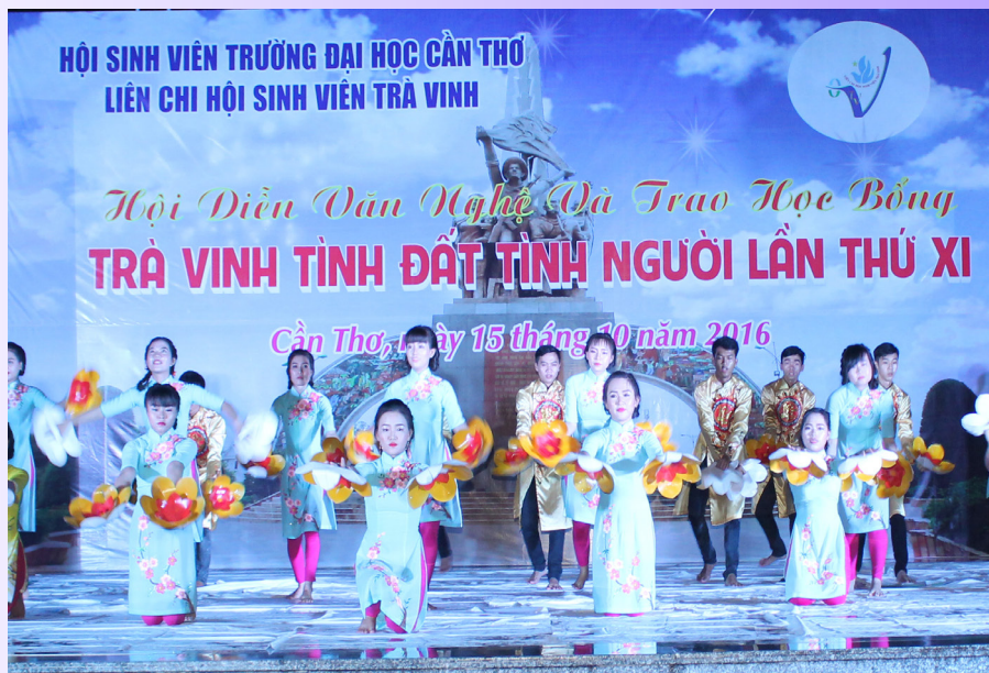
Tiết mục "Việt Nam gấm hoa" của chi hội Châu Thành và Trà Cú.

của các bạn với nghệ thuật-những cú ngã do sân khấu trơn vì trời mưa và hơn hết là ân tình của những người con Trà Vinh với nhau.