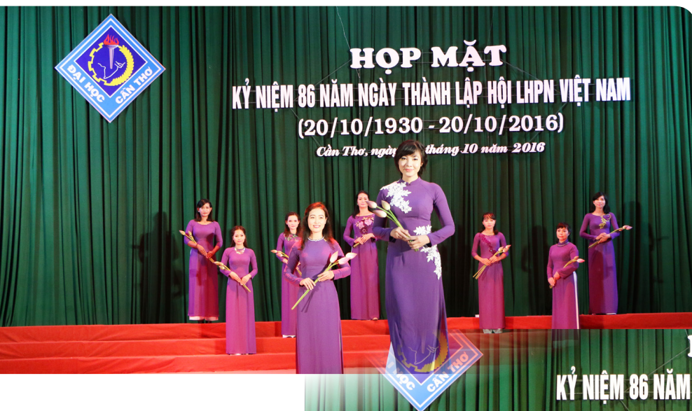
Với tiết mục biểu diễn mang tên "Sắc sen" các nữ công đoàn viên thật dịu dàng trong trang phục truyền thống.