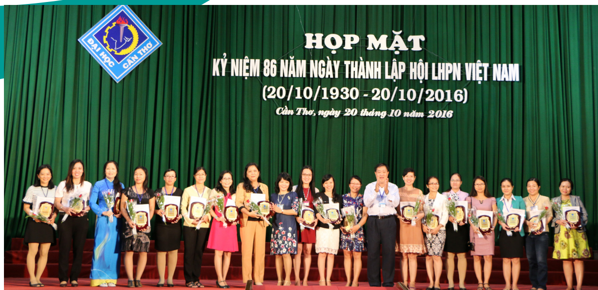
Vinh danh nữ giảng viên đạt học vị Tiến sĩ giai đoạn 2014-2016.