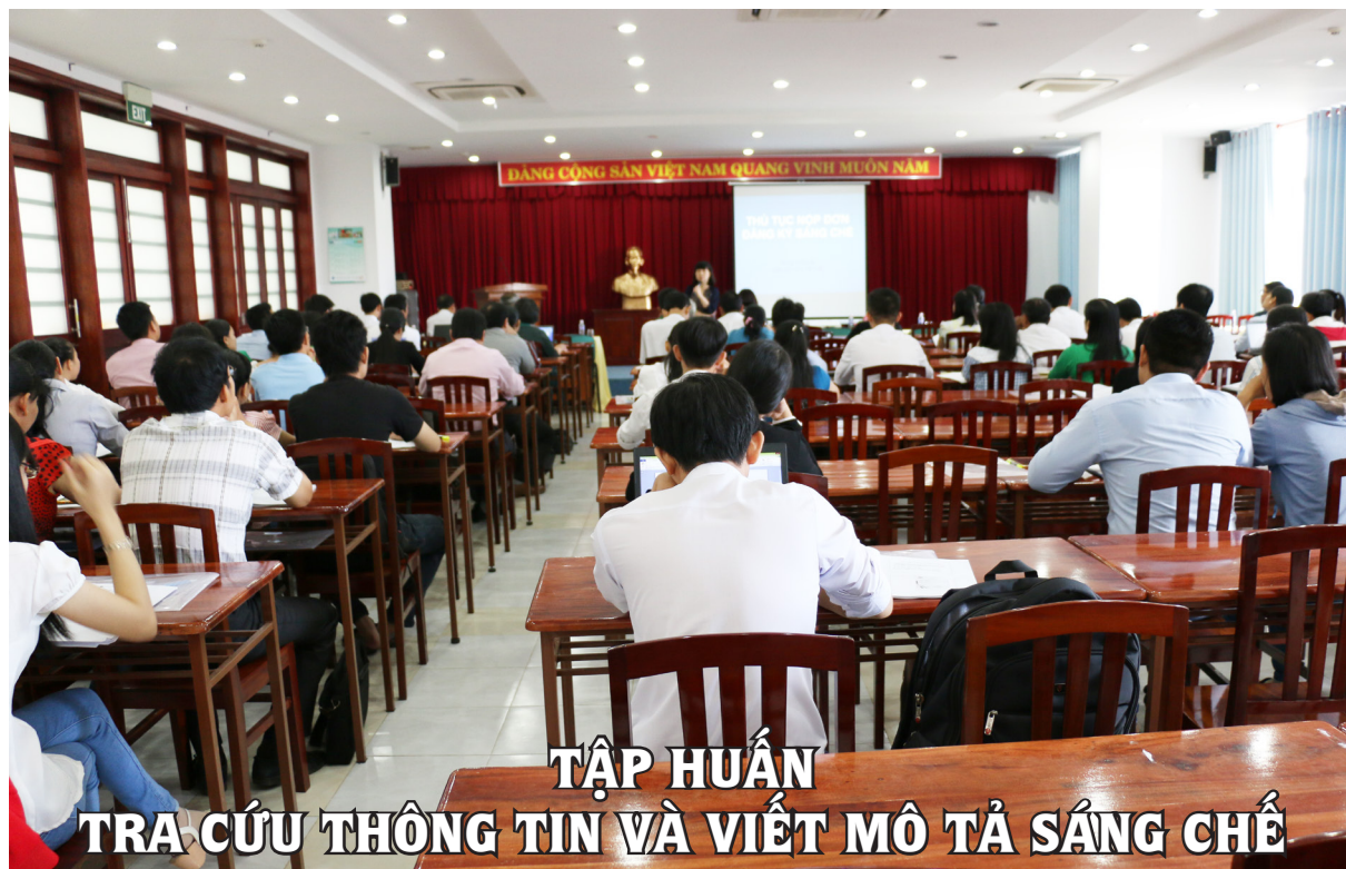
Phòng Quản lý Khoa học

N hằm giúp các nhà khoa học của Trường Đại học Cần Thơ (ĐHCT) nắm bắt và hiểu rõ về tầm quan trọng của hoạt động sở hữu trí tuệ (SHTT), ngày 05/10/2016, Cục SHTT phối hợp với Trường ĐHCT tổ chức lớp “Tập huấn tra cứu thông tin và viết mô tả sáng chế”.