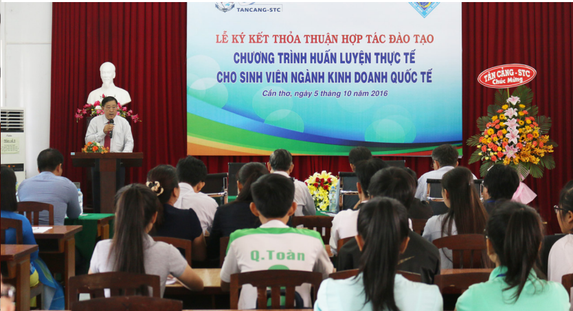
Lễ Ký kết thỏa thuận hợp tác đào tạo giữa Khoa Kinh tế và Công ty TNHH Phát triển Nguồn nhân lực Tân Cảng - STC.

Lễ Ký kết thỏa thuận hợp tác đào tạo giữa Khoa Kinh tế, Trường Đại học Cần Thơ và Công ty TNHH Phát triển Nguồn nhân lực Tân Cảng-STC về chương trình huấn luyện thực tế cho sinh viên ngành Kinh doanh quốc tế được diễn ra vào ngày 05/10/2016.