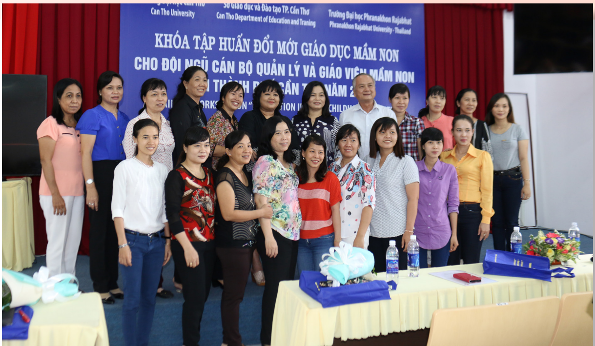
Các học viên chụp hình lưu niệm cùng đại biểu.

Thời gian qua, việc đào tạo, bồi dưỡng giáo viên các cấp của thành phố Cần Thơ rất được chú trọng trong yêu cầu đổi mới hiện nay. Tuy nhiên, việc tiếp cận với tư duy và phương pháp giáo dục mới của các nước tiên tiến trên thế giới, có nền giáo dục phát triển còn nhiều hạn chế. Từ nhu cầu cấp thiết đó, Khóa tập huấn Đổi mới giáo dục mầm non diễn ra từ ngày 10 đến ngày 12/10/2016 dành cho 240 cán bộ quản lý và giáo viên mầm non của 09 quận, huyện của thành phố Cần Thơ, nhằm trang bị cho giáo viên kiến thức cập nhật trong phương pháp dạy học, kỹ năng giao tiếp sư phạm trong lớp học giữa giáo viên, học sinh và phụ huynh học sinh từ đó đổi mới nhận thức, nâng cao tư duy, phương pháp giáo dục, phương pháp chăm sóc để trẻ phát triển một cách tốt nhất vì giáo dục mầm non là giai đoạn quan trọng nhất trong sự phát triển sau này của trẻ.