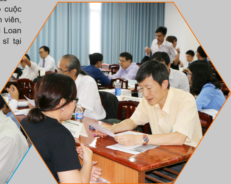
Một số hình ảnh tại buổi phỏng vấn.