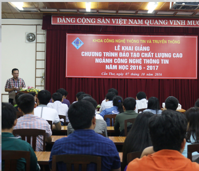
Lễ Khai giảng Chương trình đào tạo Chất lượng cao ngành Công nghệ thông tin năm học 2016-2017 tại Hội trường II, Khoa Công nghệ Thông tin và Truyền thông.

Ngày 07/10/2016, Khoa Công nghệ Thông tin và Truyền thông, Trường Đại học Cần Thơ (ĐHCT) tổ chức Lễ Khai giảng Chương trình đào tạo Chất lượng cao ngành Công nghệ thông tin năm học 2016-2017.