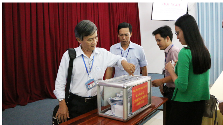
Quyên góp, ủng hộ đồng bào vùng lũ tại Hội nghị.

Nhằm sẻ chia phần nào những khó khăn mà đồng bào vùng lũ đang phải gánh chịu, các đồng chí có mặt đã tiến hành quyên góp, ủng hộ cho bà con vùng lũ miền Trung. Trước đó, Trường ĐHCT đã kịp thời hỗ trợ số tiền 120 triệu đồng thông qua Ủy ban Mặt trận Tổ quốc Việt Nam. Trong thời gian tới, Trường ĐHCT sẽ tiếp tục kêu gọi và tiếp nhận sự đóng góp tích cực từ toàn thể cán bộ, viên chức, người lao động tại các đơn vị trong Trường và các em sinh viên để giúp đỡ đồng bào bị thiên tai giải quyết những khó khăn trước mắt và sớm ổn định cuộc sống.