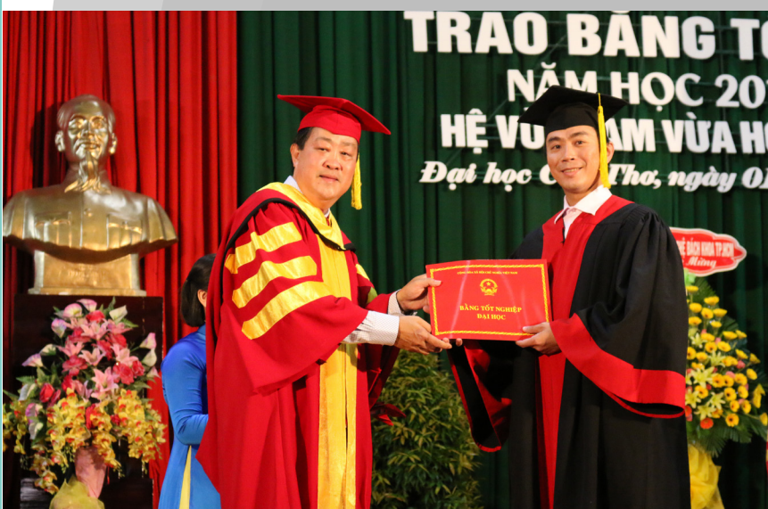
Hiệu trưởng trao bằng tốt nghiệp cho các tân khoa.

Với những kết quả đạt được như trên, Trường ĐHCT ngày càng khẳng định chất lượng đối với hình thức đào tạo hệ vừa làm vừa học và hệ đào tạo từ xa. Trong thời gian tới, Trường sẽ không ngừng cải tiến, tìm giải pháp để nâng cao hơn nữa chất lượng đào tạo, song song với việc tăng cường hợp tác với các đơn vị liên kết nhằm phục vụ tốt hơn nhu cầu của xã hội.