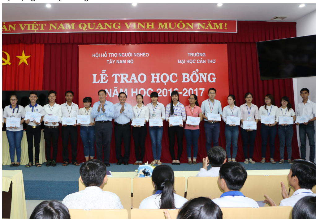
Trao học bổng cho sinh viên.