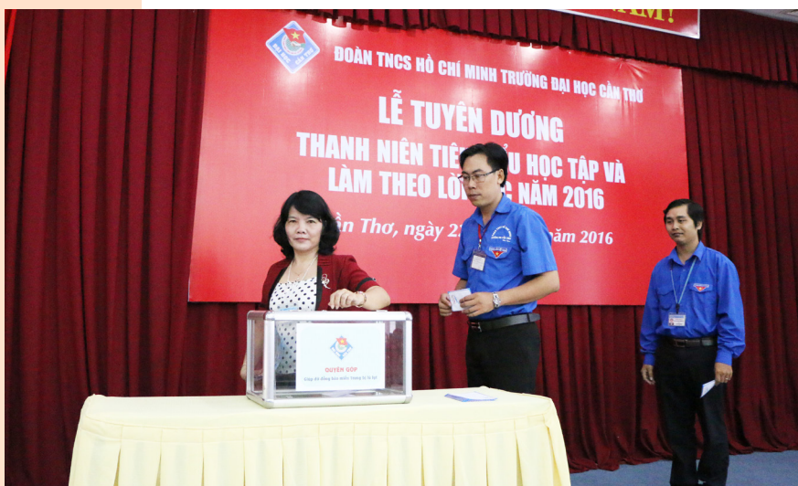
Quyên góp ủng hộ đồng bào miền Trung.

Nhân dịp này, Ban Thường vụ Đoàn trường đã phát động quyền góp ủng hộ đồng bào miền Trung bị thiên tai, lũ lụt và nhận được sự hưởng ứng tích cực từ cán bộ đoàn, đoàn viên thanh niên, hội viên tham dự lễ và đợt phát động sẽ diễn ra trong toàn thể đoàn viên thanh niên, hội viên trong Trường đến ngày 27/10/2016.